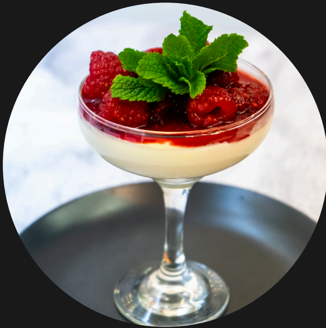
Mango Mousse with Raspberries