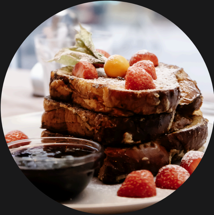
French Toast Francia pirítós