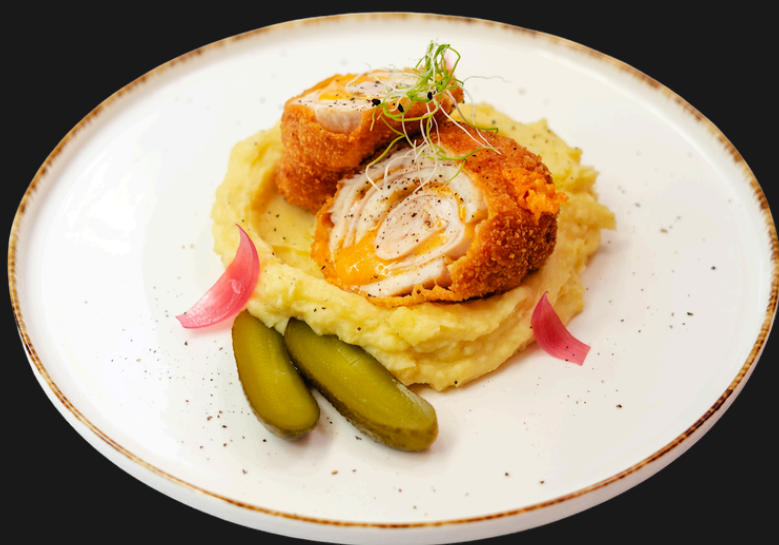
Cordon Bleu with Mashed Potatoes and Pickles

Cordon bleu burgonyapürével, savanyú uborkával