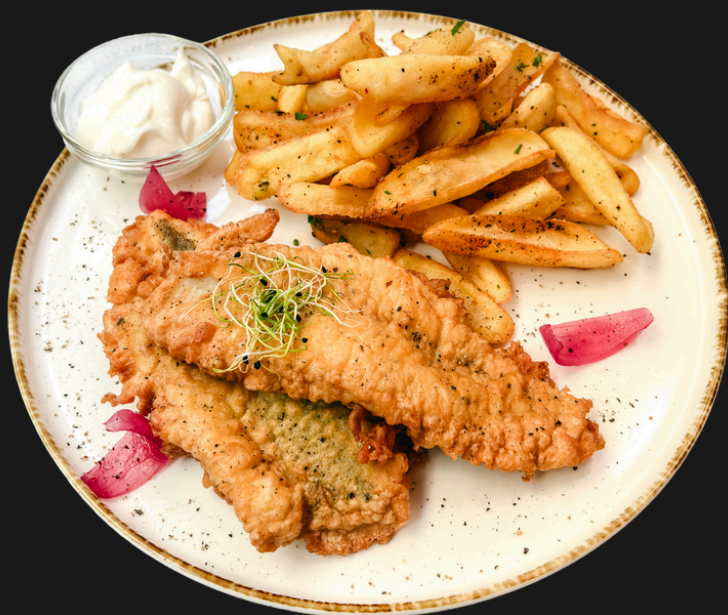
Fish and Chips